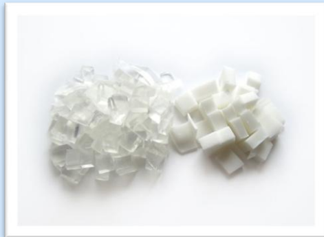
Рисунок 2. Этап 2

Материал: мыльная основа, пигментные красители, парфюм, отдушка, блестки, форма для изделия.