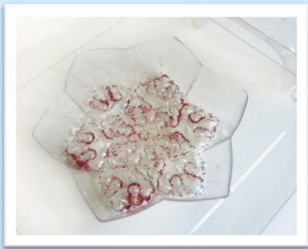
Рисунок 4. Этап 4

Растопить мыльную основу на водяной бане или в микроволновой (СВЧ) печи, не доводя до кипения. Добавить к получившейся массе 3-4 капли красителя, 5 капель парфюм, отдушки.