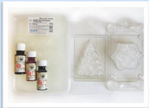
Рисунок 1. Этап 1

Материал: мыльная основа, пигментные красители, парфюм, отдушка, блестки, форма для изделия.