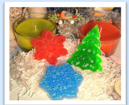
Рисунок 6. Этап 6