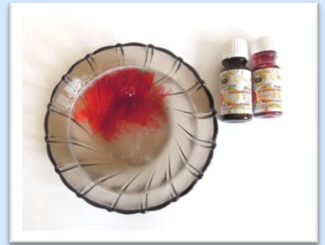
Рисунок 3. Этап 3

Растопить мыльную основу на водяной бане или в микроволновой (СВЧ) печи, не доводя до кипения. Добавить к получившейся массе 3-4 капли красителя, 5 капель парфюм, отдушки.